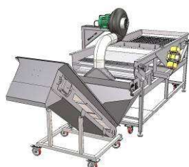
Mistral® 100 OLC NG avec élévateur